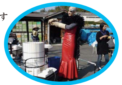
まちに飛び出す アート屋台