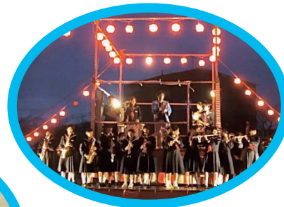
多世代コラボの作品