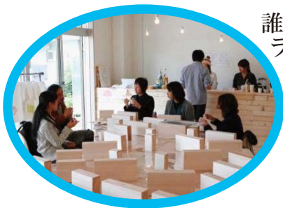
誰でもが集える ラウンジとして

9ヶ月間、毎週末企画を開催することで、Tappino は誰でもいつでもアートに触れられる場所となります。アーティストと地域住民の交流を発生させ、そこから生まれる相互作用を「アートの種」として育て、開花させる仕組みづくりをめざします。